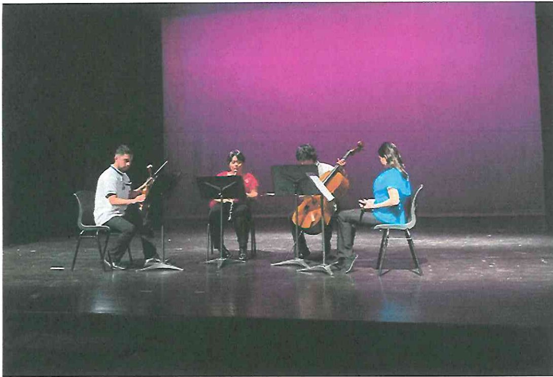
En escena, interpretación "Un Alba en Amatlán"