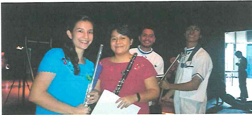
Justo antes de salir a escena