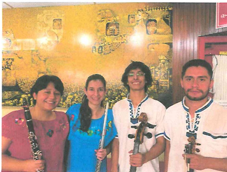
En el lobby luego de nuestra presentación.