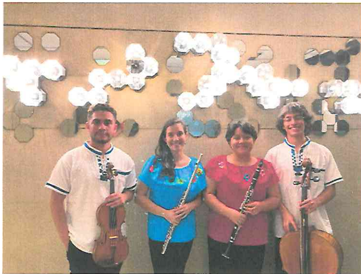
En el lobby del Teatro de Cámara "Hugo Carrillo", después de la presentación