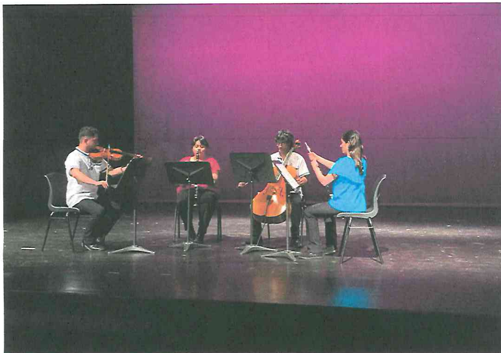
En escena, afinando antes de empezar