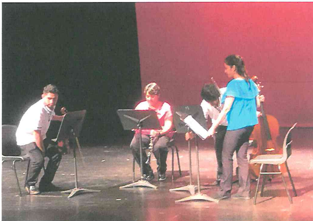
Preparándonos en escena