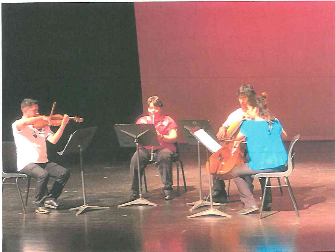
Preparándonos en escena, Interpretación "Un Alba en Amatitlán"