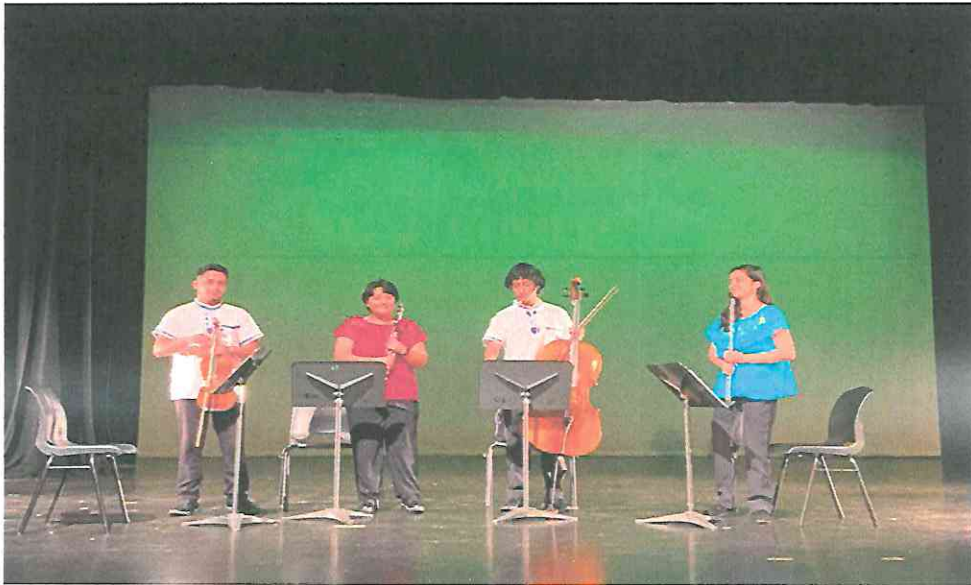
Saludando al público luego de nuestra presentación