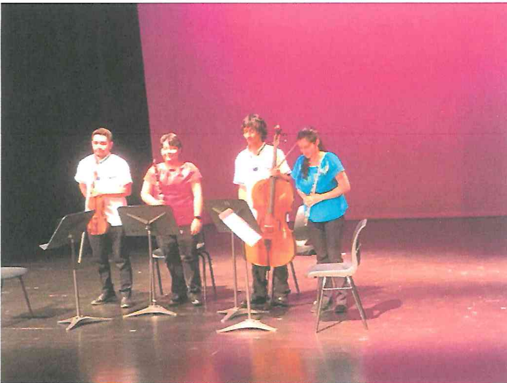
Saludando al público al finalizar la interpretación