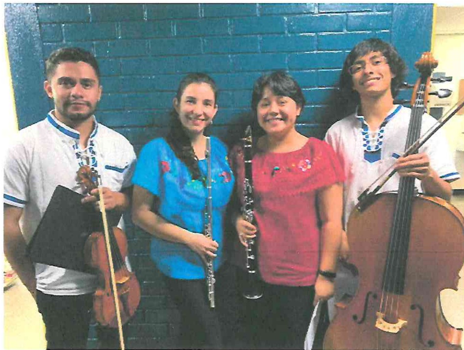
En camerinos luego de nuestra presentación.